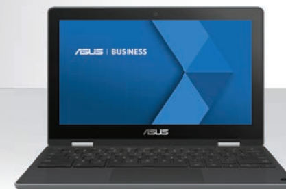
ASUS ChromeBook-R Série 1