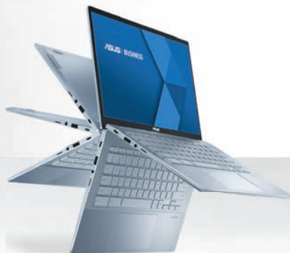
ASUS ChromeBook Séries 3/5