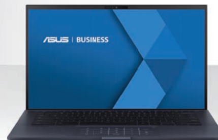
ASUS ChromeBook Série 9