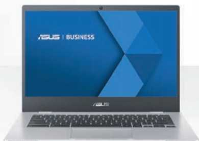
ASUS ChromeBook Série 1